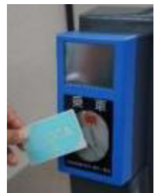
▲車載型IC改札機（写真は入場用）

市は、紀勢本線活性化促進協議会の会員として、鉄道の利用促進に取り組んでいます。 きのくに線（紀伊田辺駅～新宮駅間）への車載型IC改札機を搭載した新型車両の導入により、3月13日①から県内全線でICOCAがご利用いただけるようになります。 ■ICOCAとは カードにチャージ（入金）することで、切符の代わりにご利用いただけるICカードです。さらにICOCA加盟店でのお買い物の際には、電子マネーとしてもご利用いただけます。ICOCAは紀伊田辺駅で購入できます。 ■使い方 ◇和歌山駅～紀伊田辺駅間の全駅・白浜駅・周参見駅・串本駅・古座駅・太地駅・紀伊勝浦駅・新宮駅 電車に乗るとき降りるとき、ICOCAを駅のIC専用改札機にかざしてください。 ◇右記以外の紀伊田辺駅～新宮駅間の駅