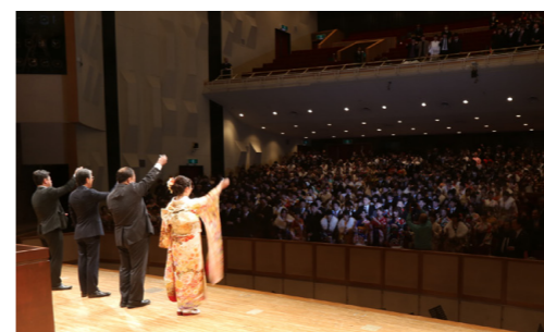
▲昨年の成人式の様子

13年4月1日に生まれた方は、本市に住民票がある方には、3月中旬に案内を送付します。市外に住所を移している方で、成人式の案内を希望される方又は出身中学校が市外の学校の方は、上記までご連絡ください。※式典内容の詳細及び参加に当たっての注意事項は、ホームページをご覧ください。くか、上記へお問い合わせください。 http://www.city.tanabe.lg.jp/shougai/kouminkan/seijinshiki.html