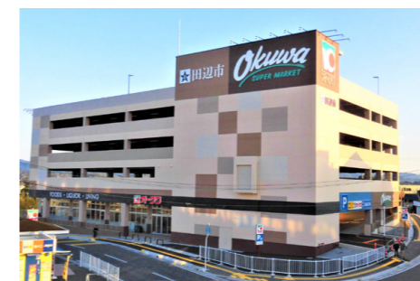
▲店舗・駐車場棟（令和3年2月撮影）

店舗・駐車場棟が竣工しました オークワ社が施主となって整備を進めていた店舗・駐車場棟は、令和3年2月10日に竣工しました。 店舗・駐車場棟は、候補地選定調査結果の発表後、近隣住民の方々からスーパの存続を求める声が多くあり、オークワ社との基本協定において、「新たな店舗による営業継続ができるように取り組む」とし、PPP（※）の一種として、官民共同で整備を進めてきたものです。 ※PPP（パブリック・プライベート・パートナーシップ）とは、官民が連携して公共サービスの提供を行う事業手法です。 ■店舗・駐車場棟の概要 建物は、オークワ社が1階及び2階部分を区分所有し、3階及び4階部分を市が購入し、区分所有します。こうしたことから、両者の区分所有建物であることを明確にするため、外壁に両者の表示をしています。 なお、下記の概要図のように、1階がオークワ社の店舗、2階が店舗の駐車場、3階から屋上が市の公用車等の駐車場となります。