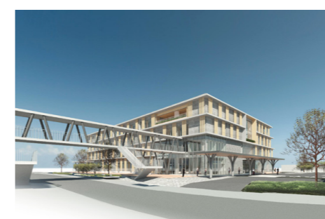
▲新庁舎外観イメージ（南東側より）

建物の敷地は、市が所有し、オークワ社には建物の専有面積割合に応じて、敷地の権利を貸し付けます。 その貸付料は、不動産鑑定士や弁護士の見解も踏まえ、条例の規定に準じながら、適正な貸付料を算定しています。