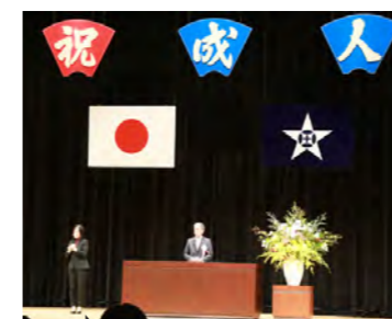
成人式でも手話通訳者が活躍!