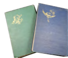
熊楠日記(昭和6・7年)