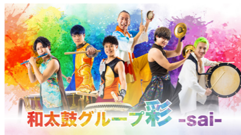
和太鼓グループ彩……東京大学のサークルとして結成され、平成25年からプロ活動をスタート。2022年大河ドラマ「鎌倉殿の13人」にも携わっています。