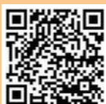
全国版救急受診ガイド「Q助」