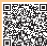
防災行政メール等

■ 田辺広域休日急患診療所 （市民総合センター玄関右側） ■ 内科、小児科、歯科の応急診療 ■ 日時 9時〜11時30分、13時〜16時 （※小児科のみ、⊕18時〜21時30分も診療を行っています。） ☎0739-26-4909