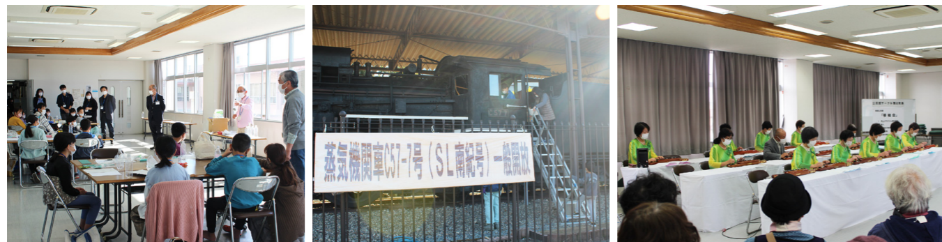
田辺市青少年少女発明クラブ