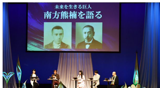
右上から 観光地域づくり支援事業(①) 市有林植栽イベント(②) 左上から 関西実業団対抗駅伝競走大会(③) 災害用備蓄品(④) 南方熊楠翁生誕150周年記念式典・シンポジウム(⑤)