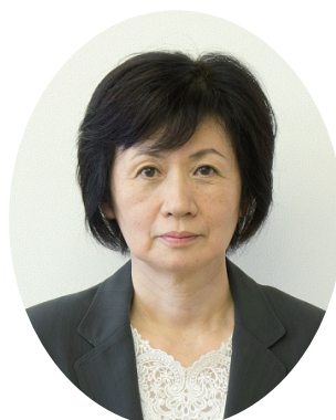
森教育長職務代理者