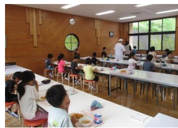
本宮小学校の給食の様子