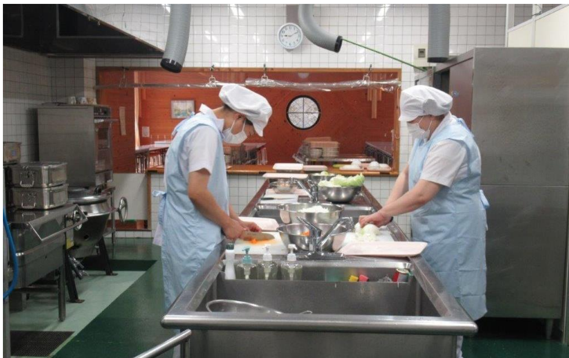
本宮中学校調理場