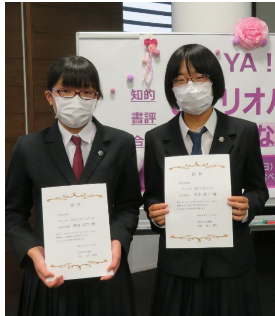
知的書評合戦 YA! ビブリオバトル I N たなべる