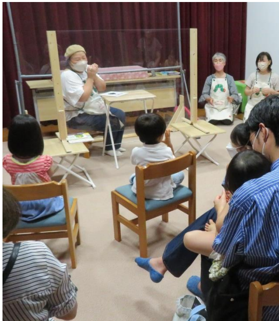
夏休み おはなしランド