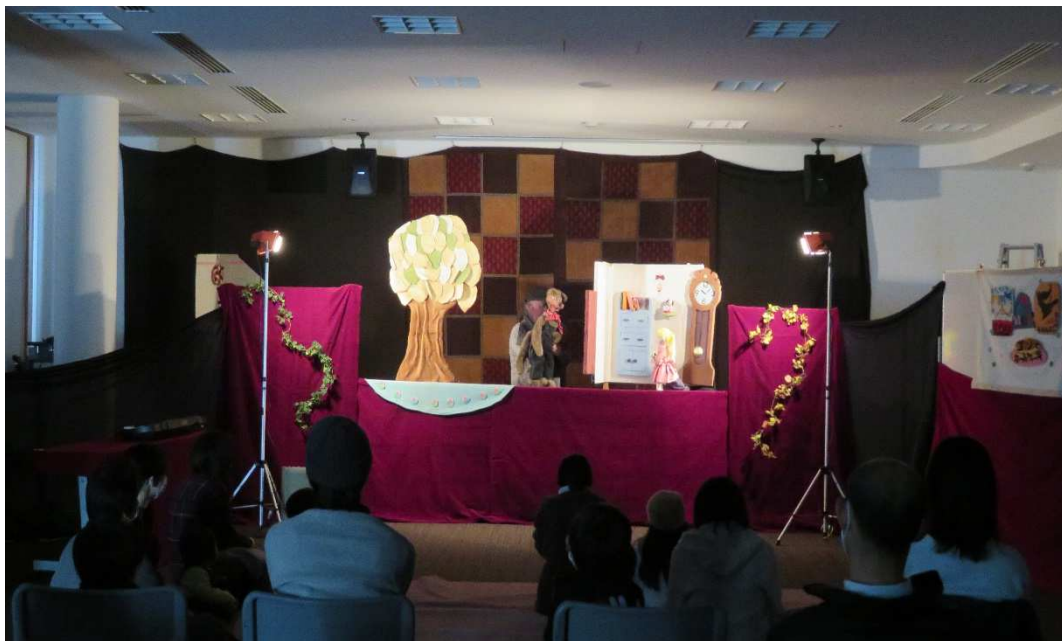
人形劇団『あした』による公演