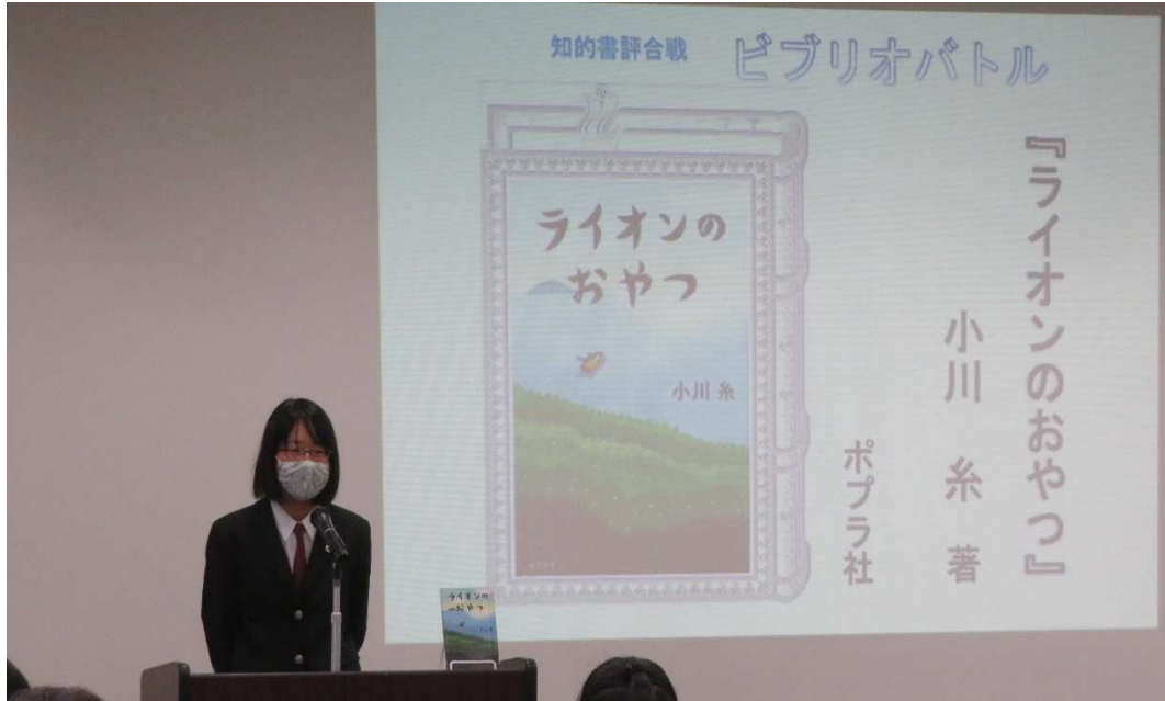
知的書評合戦 YA! ビブリオバトル IN たなべる