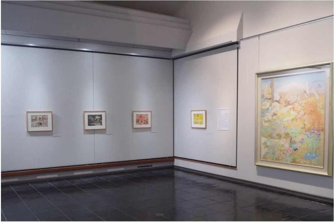
特別展「絵本にみる日本画」展示風景（田辺市立美術館）