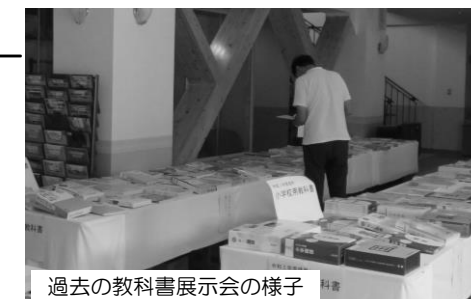
過去の教科書展示会の様子