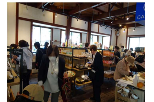
【ふるさとセンター】