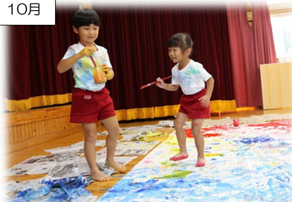
遊戯室に広げられた大きな紙に、絵の具を使ってダイナミックにお絵描きしました。