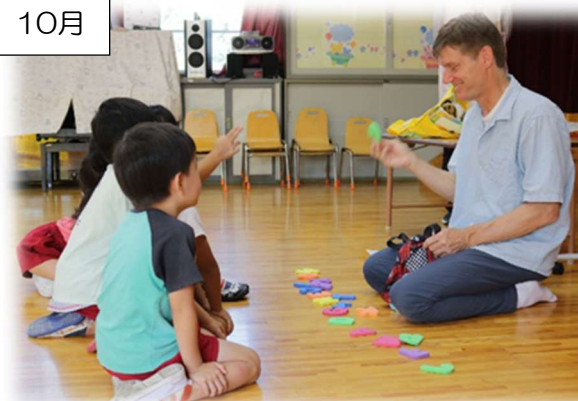
ゲームをしたり、体を使ってアルファベットを表現したり・・・楽しく英語に触れてます。