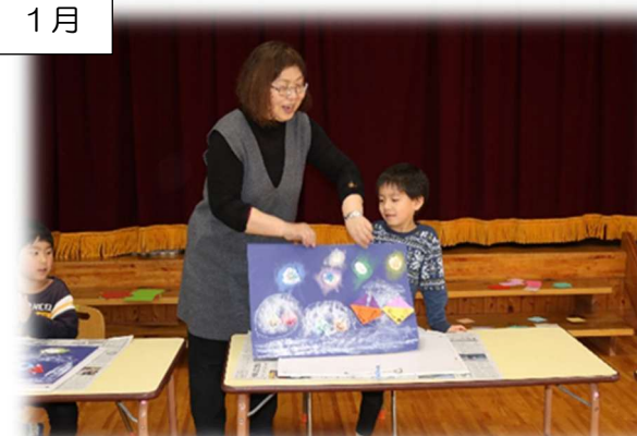
コンテを使って、ふんわりやさしい作品ができました。最後はみんなで鑑賞会です。