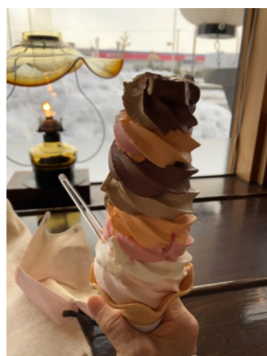
やんちゃひめさん