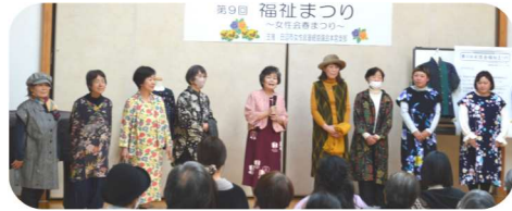
ファッションショー（森の仕立て屋さん）