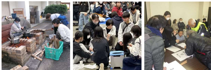
中学校避難所 Big・U避難所 清浄館避難所