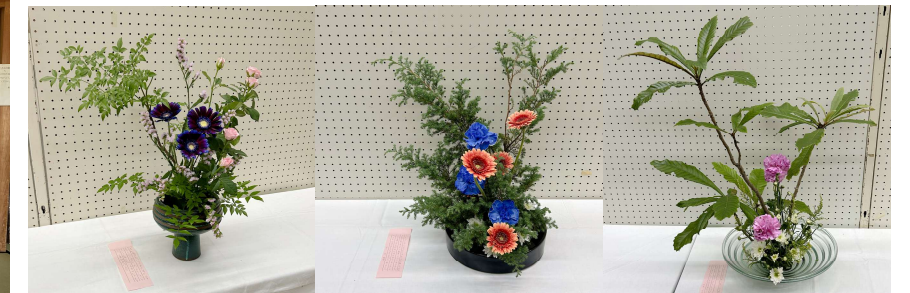
生徒が文化祭で生けた作品たちです。皆さん1年間よく頑張りました。