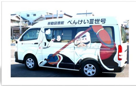
べんけい3世号（各ステーション）

移動図書館車は車内にたくさんの本を収納し地域を巡回しています。毎月1回、決まった時間に各ステーションを巡回して、その場で本の貸出・返却を行っています。移動図書館車を見かけた際には、お気軽にお立ち寄りください。（お問い合わせ先）本宮教育事務所 0735-42-1164