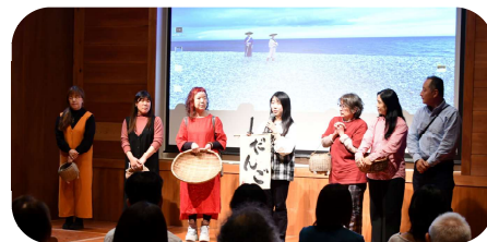
映画出演者の皆さん

4月12日（日）世界遺産熊野本宮館において、熊野古道世界遺産登録20年記念「熊野伝説皿夕凧」が上映されました。この作品は「熊野映画を創る会」が2024年に制作したもので、「和歌山県南部、三重県南部」をロケ地に撮影が行われました。漁に出た漁船が嵐で沈没、戻らぬ人を想っている中、熊野の山奥にひとつだけ願いをかなえてくれる神社があると聞き、主人公がその神社を目指して旅をするという内容で多くの方に来場していただきました。上映後は、出演者の方々に登壇いただき、出演時の思い出や苦労話を話していただきました。