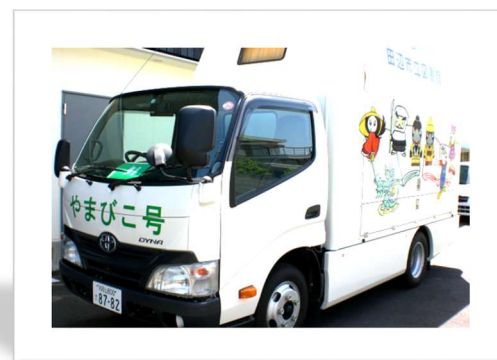
やまびこ号（小学校・保育園）