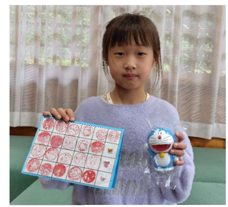
みなぎさん1冊目 (小学2年生)