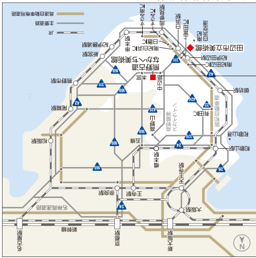
アケスアツツ・和歌山県周辺