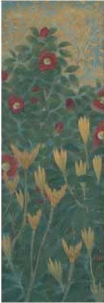
《新芽ふく頃》 1918(大正7)年頃

現在の田辺市中辺路町近露に生まれる。本名弘男。14歳で大阪に出て、中川蘆月に入門、蘆秋の号を受ける。1907(明治40)年から京都に移り、谷口香嶠のもとで学ぶ。1909(明治42)年、新設された京都市立絵画専門学校の第一期生として入学、この頃から晩花と号する。同期に土田麦僊、小野竹喬、榊原紫峰、村上華岳らがいた。1911(明治44)年、第16回新古美術展で三等賞を受賞。1918(大正7)年、上記の京都市立絵画専門学校の同期生4名と国画創作協会を創立して展覧会を主宰する。日本画の表現を刷新する作品を次々と発表して注目されるが、1927(昭和2)年の第6回国画創作協会展への出品を最後に画壇から離れた。1930(昭和5)年から度々中国に渡り、そのスケッチを発表する。1946(昭和21)年、疎開中に交流の生まれた長野県の画家や歌人たちと白炎社を結成して活動し、当地の文化活動に貢献した。