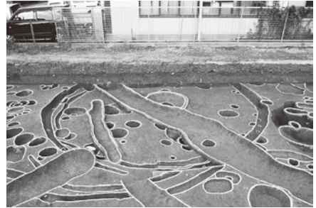
太田・黒田遺跡(和歌山市)