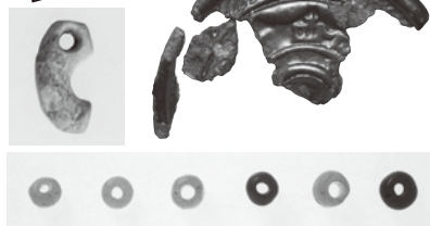
旧吉備中学校校庭遺跡出土品(有田川町)