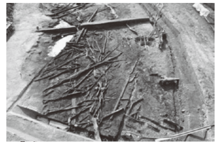
立野遺跡(すさみ町)