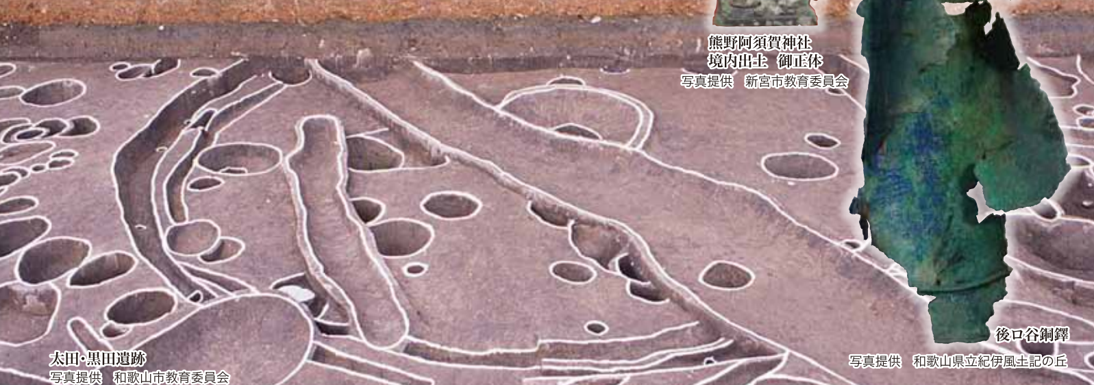
太田・黒田遺跡

主催 ◆ 公益財団法人 和歌山県文化財センター 共催 ◆ 和歌山県立紀伊風土記の丘・御坊市教育委員会・田辺市教育委員会 後援 ◆ 和歌山県教育委員会・和歌山市教育委員会・有田川町教育委員会・新宮市教育委員会・白浜町教育委員会・すさみ町教育委員会 公益財団法人 和歌山市文化スポーツ振興財団・一般社団法人 和歌山県文化財研究会・宗教法人 阿須賀神社