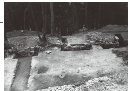
安宅荘中世城郭群(白浜町)