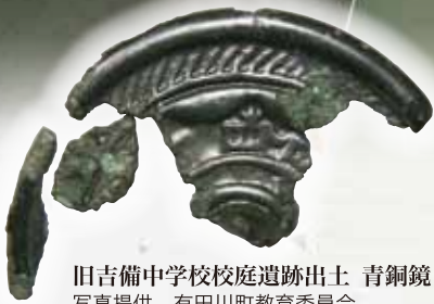
旧吉備中学校校庭遺跡出土 青銅鏡