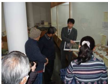
2月7日(土) ギャラリートークの様子