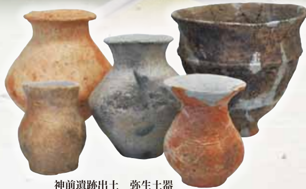
神前遺跡出土 弥生土器