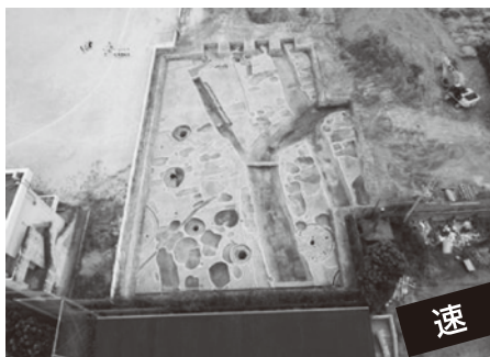
小松原Ⅱ遺跡・湯川氏館跡(御坊市)