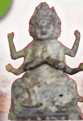
熊野阿須賀神社 境内出土 御正体