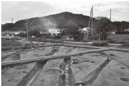
神前遺跡 (和歌山市)