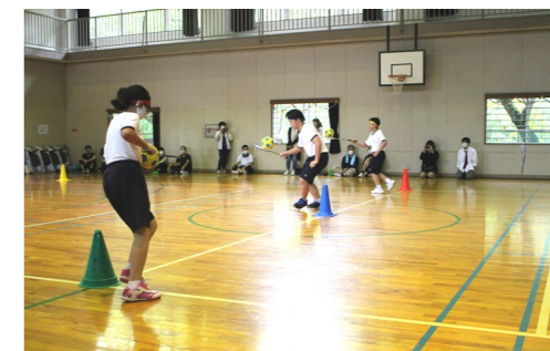
チーム対抗の「ラケットリレー」