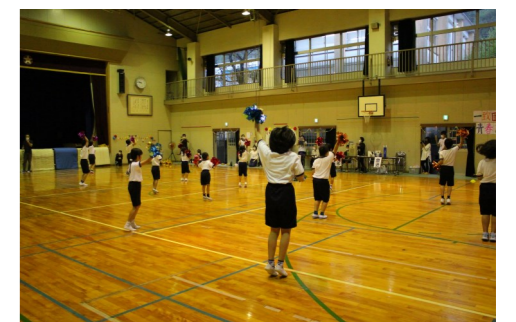
全校児童によるダンス。 「紀州っ子がやきエクササイズ」