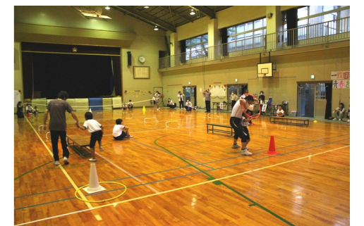
親子で協力！ 「秋津川オリンピック2020」