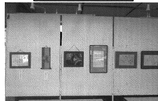
もじ楽教室展示の様子