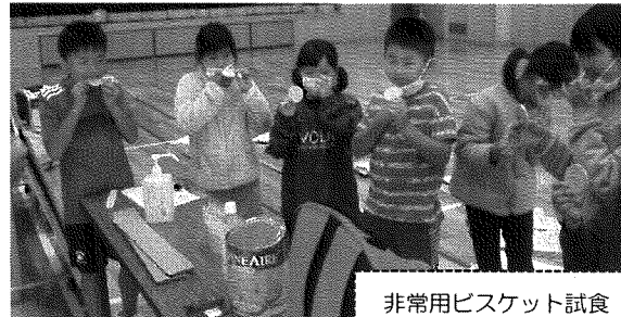
非常用ビスケット試食