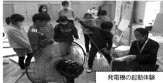
発電機の起動体験

最後には、停電時の体験としてポータブル発電機の起動と投光器の点灯、非常用食料のビスケットを試食しました。