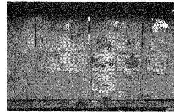
ひまわり保育園展示の様子