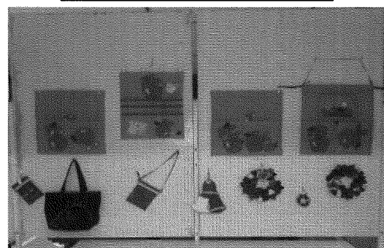
プチャブ手芸教室展示の様子