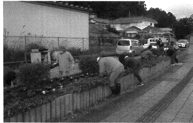
花植え作業の様子