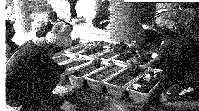
花植え作業の様子

1月22日（金）本宮中学校において学社融合の取組である花配りの準備を行いました。この行事は平成23年の紀伊半島大水害から復興と景観づくりとして本宮地区の国道沿いにプランターに植えた花の設置を生徒と地域団体が取り組んだもので、現在はまちを訪れる方々を気持ちよくお迎えしたいという思いから継続して行っています。今回の花植えに先立ち、あらかじめ12月に生徒と地域団体の皆様が協力して、前回使用した土をふるいにかけたあと、肥料を漉き込んだ用土を約120個のプランターに用意しました。当日は地域の協力者から指導を受けながら1・2年生が花植え作業を開始、和気あいあいと360苗のパンジーを植付けました。例年であれば続けて3年生が花を植えたプランターを軽トラックに積み込み配布作業を行っているのですが、当日はあいにく降雨のため、花配りは1月27日に延期しました。今回、土づくりや花植え作業にご指導・ご協力をいただいた『学校ボランティア・プロバスクラブ・女性会・公民館・その他協力員の皆様』ありがとうございました。