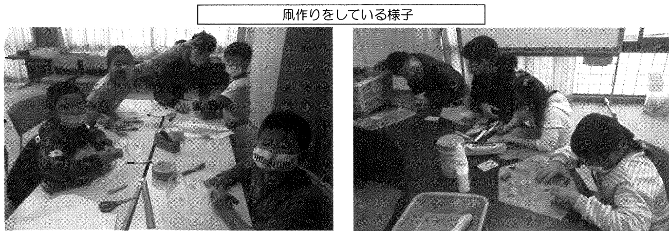
凧作りをしている様子

子どもらは期間中楽しく過ごしたようで「春休みの子どもの居場所も参加する！」と元気に話をしていました。