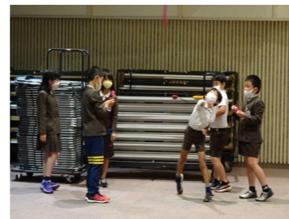
▼【ふれあいスクール活動の様子】