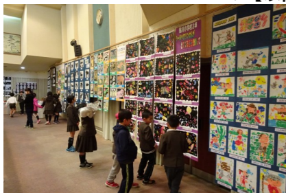
▼【以前の作品展示会の様子】

※ 保育園児や小中学生の作品、日頃から活動されている地域のサークルや団体及び個人の方々の力作を展示します。皆さんの日ごろの成果をぜひご覧ください。