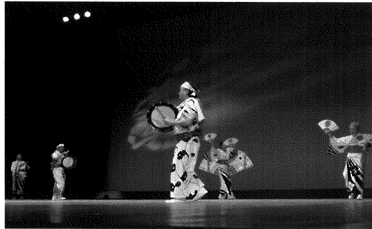
大瀬の太鼓踊りの様子