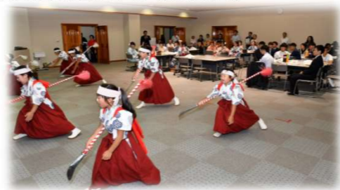
平治川の長刀踊りを披露している 新成人を祝う会での1コマ