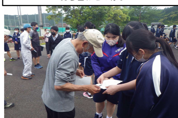
打ち合わせの様子