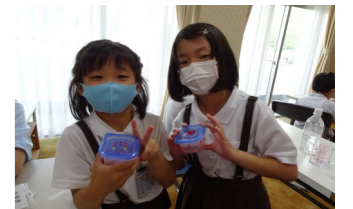
【パレットスライム作り】