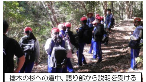
捻木の杉への道中、語り部から説明を受ける

また、11月12日には、第3回子ども環境探偵団「潮見峠越ウォーク」を開催。中辺路小学校6年生が、元気に学校を出発し、木や草花、木の実などの説明を受けながら、潮見峠を目指しました。潮見峠では、講師らから、歴史上の出来事をはじめ、昔の熊野詣やその周辺の様子について教わり、捻木の杉では、杉の太木を眺めみんなで昼食をとりながら、海が見えるすばらしい眺望を満喫することができました。