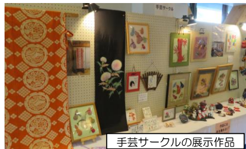
手芸サークルの展示作品

賞している様子で、なかには、「展示作品を見て、自分も昔やっていた押し花をまたやってみたくなったわあ。」と、作品を通して「作る楽しみ」にまで響いた様子の方もおられました。出展者からは、「長期間展示ができて、多くの人に見てもらえる機会はめったになくて、貴重だと感じた。」「来年に向けて、今から、またがんばろう。目標があることは、とても励みになる。」とのご感想もいただきました。