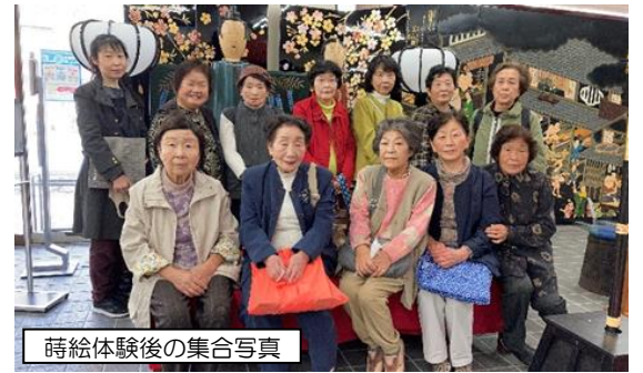
蒔絵体験後の集合写真

(※蒔絵とは：漆器の表面に漆で絵を描き、それが乾かないうちに金や銀の金属粉を「蒔(ま)く」ことで美しい色を器面に定着させる技法)