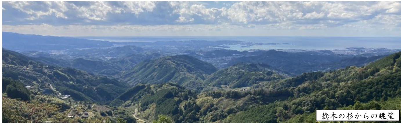
捻木の杉からの眺望

皆様方におかれましては、穏やかな初春をお迎えのこととお慶び申し上げます。旧年中は公民館活動にご支援ご協力を賜り、誠にありがとうございました。本年も地域の生涯学習の場として、皆様に親しまれる公民館を目指し、職員一同、より一層努力して参りますので、ご指導ご鞭撻のほどよろしくお願いいたします。