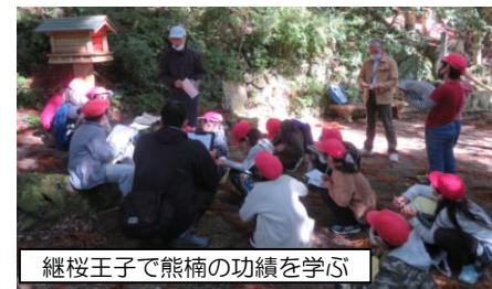
継桜王子で熊楠の功績を学ぶ

中辺路公民館主催中辺路子ども環境探偵団では、中辺路町内の小学生たちと教室を飛び出し、ふるさと中辺路の自然や歴史に縁ある様々な地を訪れ、フィールドワーク学習を行っています。