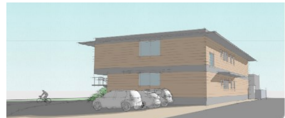
県道側（別庄橋付近）から見た外観