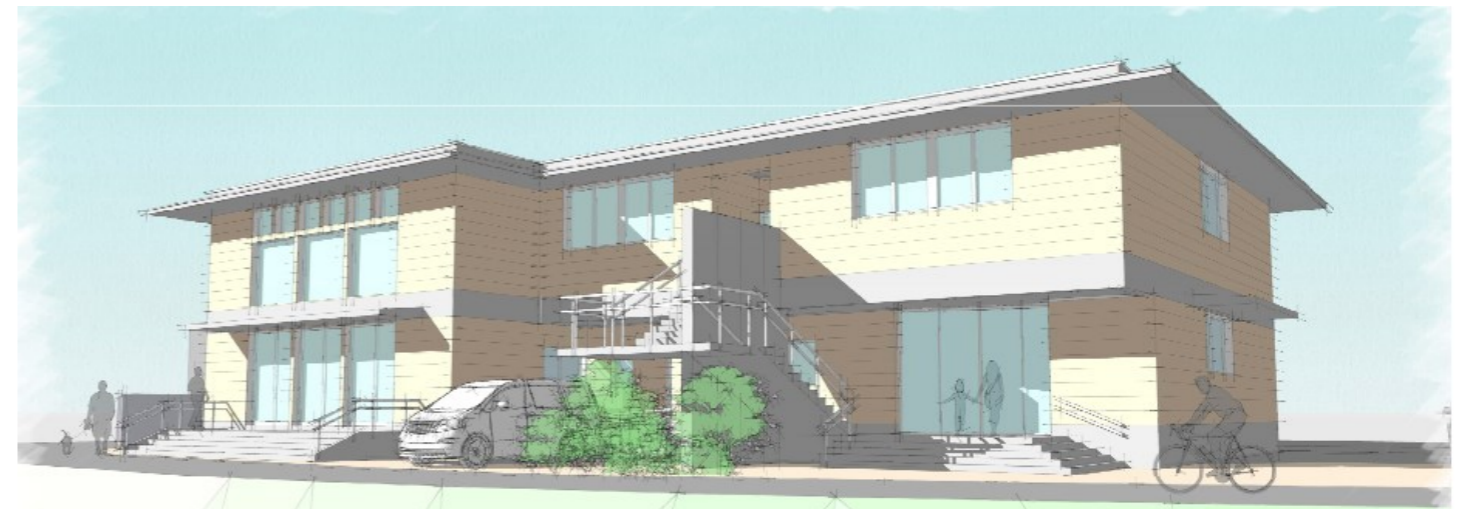
稲成町民センター側から見た外観