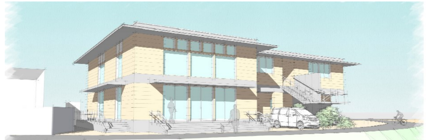
稲成町民保育所側から見た外観