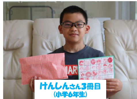
けんしんさん3冊目 (小学6年生)