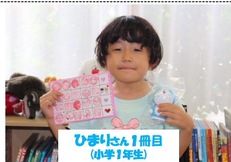
ひまりさん1冊目 (小学1年生)