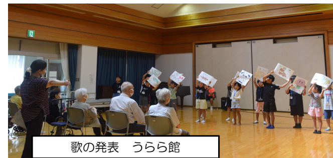
歌の発表 うらら館