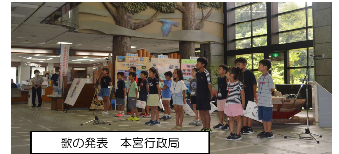
歌の発表 本宮行政局