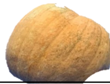
子どもの部 9.4 kg