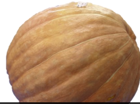
大人の部 19.8 kg

入賞者の方々には、ささやかですが、賞品をお送りいたします。お手元に届くまで少々お待ちください。（10月末頃に発送を予定しています。）