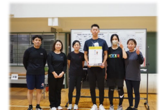
準優勝 3年生Aチーム