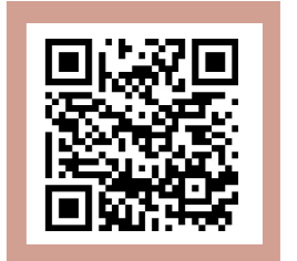
【参加申込みフォーム】