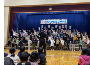
【さわやかコンサート】

11月12日に福岡県で開催された全日本合唱コンクール全国大会に、合唱部が出場しました。素晴らしいホールで演奏できることを喜びながら、精一杯演奏し、銅賞を受賞しました。また、11月18日には会津校区協議会主催の第14回会津さわやかコンサートが開催されました。小学校各学年の合唱や合奏、小学校合唱部、高雄中学校吹奏楽部の演奏が