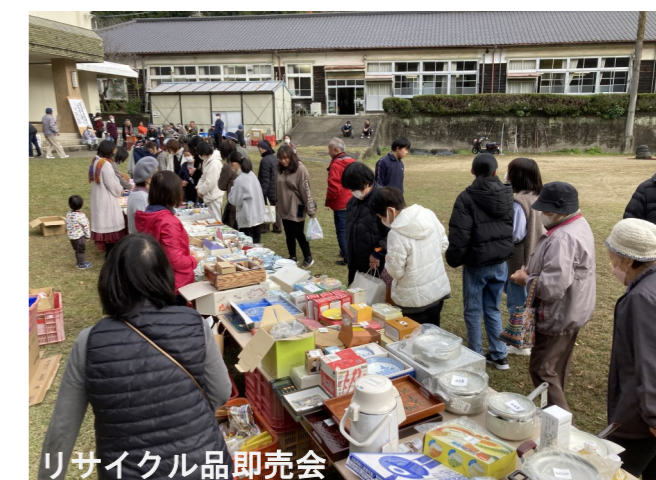
リサイクル品即売会