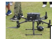
グラウンドゴルフ大会

なんぶフェスティバルの開催に際しては、地域の多くの皆様にご協力いただきました。イベントへの参加・運営等、ご協力いただきました皆様、ありがとうございました。