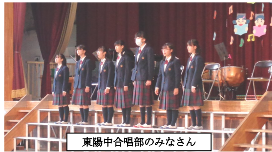
東陽中合唱部のみなさん