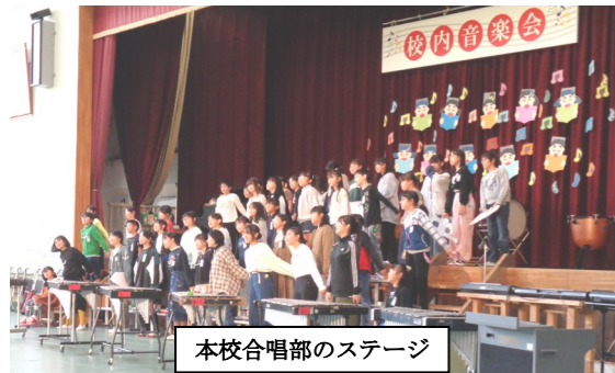
本校合唱部のステージ