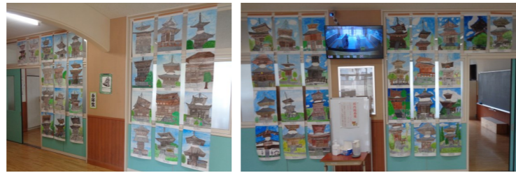
校内絵画展の作品 6年生