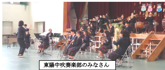
東陽中吹奏楽部のみなさん