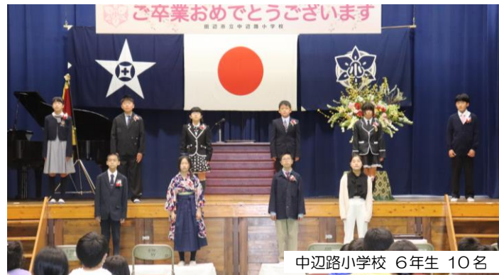
中辺路小学校 6年生 10名