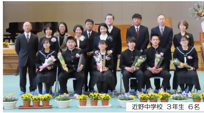
近野中学校 3年生 6名