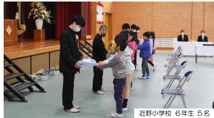
近野小学校 6年生 5名