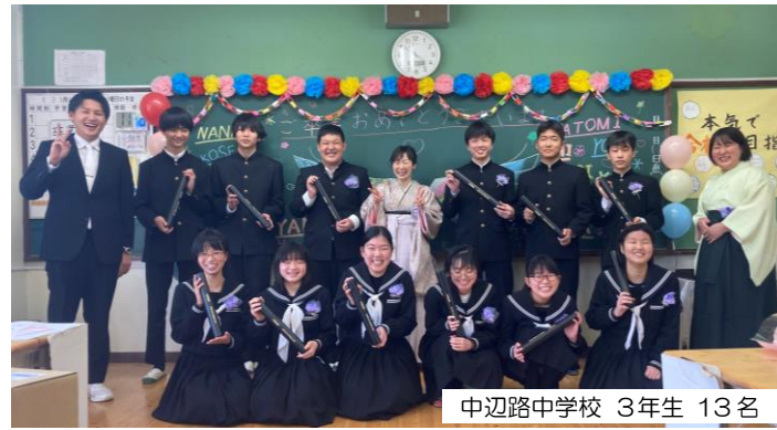
中辺路中学校 3年生 13名