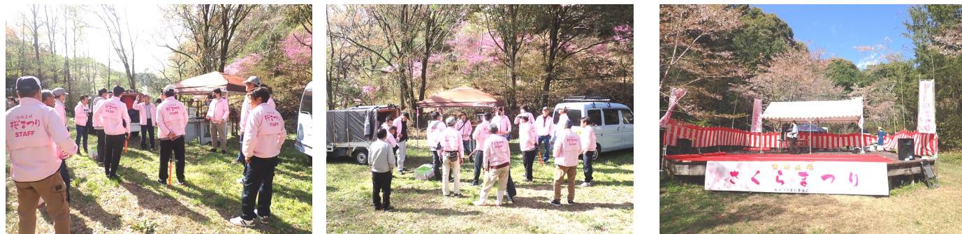
開催前のスタッフミーティングの様子 成功を願って入念に打ち合わせをしました。