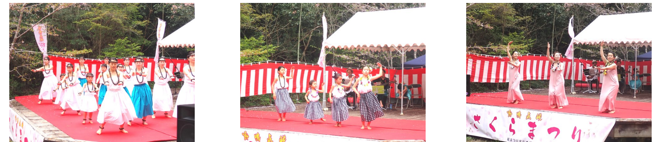
小さい子供から大人まで素晴らしいダンスを披露していただきました。 子供たちの衣装も可愛らしかったです。