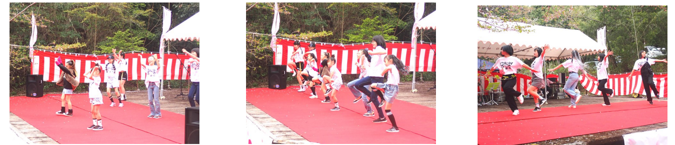
激しい動きのダンスを披露してくれました。 見ただけで「しんどそう～」と感じました。