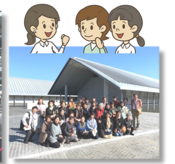
【田辺支部研修会】 （滋賀県 佐川美術館）

年齢に関係なく、入会できます。会費は年間1,000円。入会申込は、田辺市教育委員会 生涯学習課（電話：26-4925 担当：中家）まで