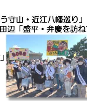
【暴力追放パレード参加】