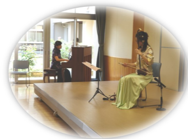
6年前にも御出演いただきました！

海南市在住。仕事を離れてからは、晴耕雨読、野菜や花を育てています。小さい頃からピアノを弾くのが大好きで、いろいろなところで演奏する機会があることを嬉しく思っています。 音楽で皆さんと一緒にできるのを楽しみにしています。