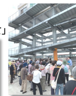
【連協交流・研修会】 （芳養津波避難タワー）