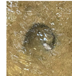
写真では分かりづらいですが、小さなへこみに石ころが入っています。こうして石ころが水流によりクルクルと回転し途方もない年月をかけて大きな穴になるのです。