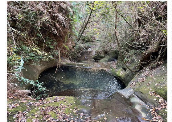
一番大きな甌穴。昨年十二月に新庄地域学社融合推進協議会のメンバーで探索にいきました。

現地まで歩いていくことも可能ですが、道中足元が悪く、時季によってはヘビ、ダニ等もあります。長靴を履くなど十分気を付けてください。