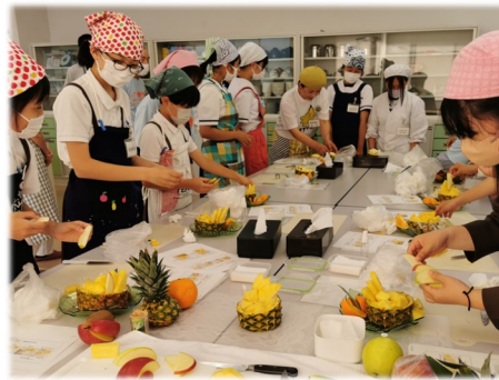
【フルーツカッティング】