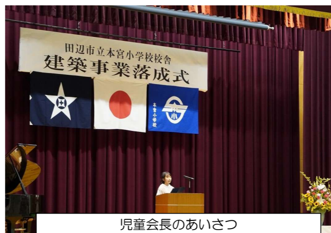
児童会長のあいさつ

建築委員会主催の記念事業では、記念DVD「本宮小学校の軌跡～そして新校舎へ～」上映やコントラバス奏者によるミニコンサート、東日本大震災復興サクラの記念植樹、最後に餅まきが行われました。