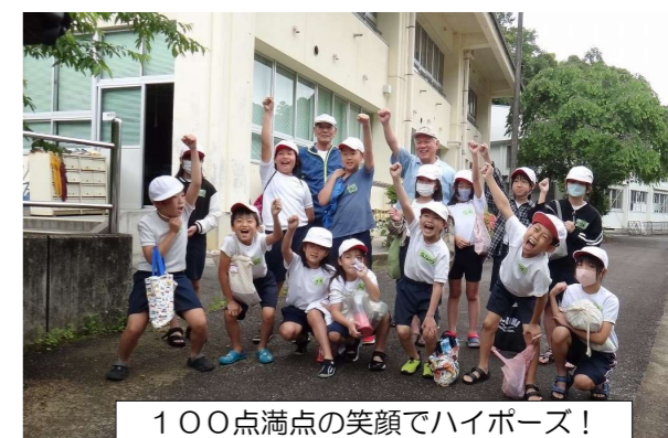
100点満点の笑顔でハイポーズ！

本宮公民館では川の生き物やスコア法、伝統漁法等をまとめた冊子「しらべてみよう！みんなの大塔川」