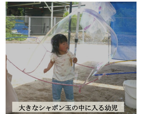
大きなシャボン玉の中に入る幼児