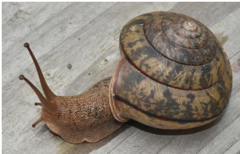
コベソマイマイ Satsuma myomphala 貝殻の模様に見えるものは軟体部の模様です。