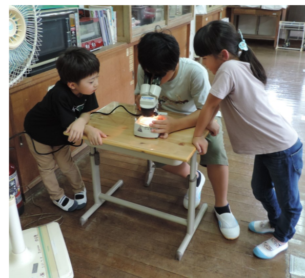
顕微鏡を覗く様子。とても“さま”になっています。