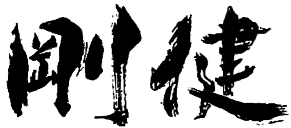
1年生掲示板の作品紹介