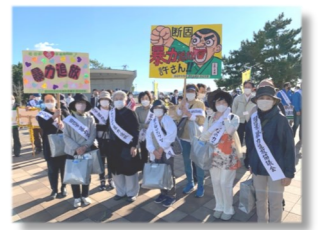
【暴力追放パレード参加】

年齢に関係なく、入会できます。会費は年間1,000円。入会申込は、田辺市教育委員会生涯学習課(電話：26-4925 担当：中家)まで