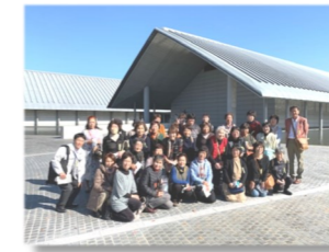
【田辺支部研修会】 (滋賀県 佐川美術館)