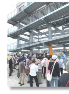
【連協交流・研修会】 (芳養津波避難タワー)