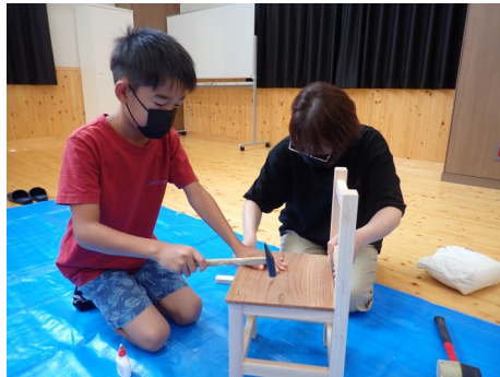
完成に向けてみんな一生懸命頑張っています