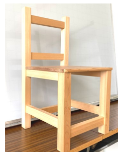
☆完成したイス 幅30cm×奥行30cm×高さ50cm

☆このイスの材料は座面がヒノキ、それ以外の部分はスギが使われており、いずれも樹齢80年位の物を使用しています。