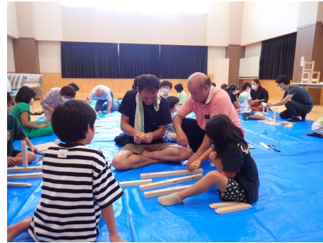
各グループを回ってアドバイスをしてくれました