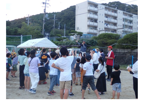
子供じゃんけん大会