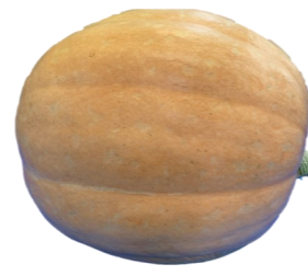
容姿端麗賞 (万呂公民館長賞)