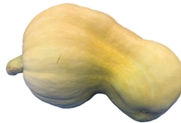
ユニーク賞 (万呂町内会長賞)

入賞者の表彰は、10月29日（日）の「秋の山野草展示会」にて行います。また、「重量当てクイズ」の結果につきましても、万呂公民館報10月号にて発表し、入賞者の表彰後、賞品を発送させていただきます。