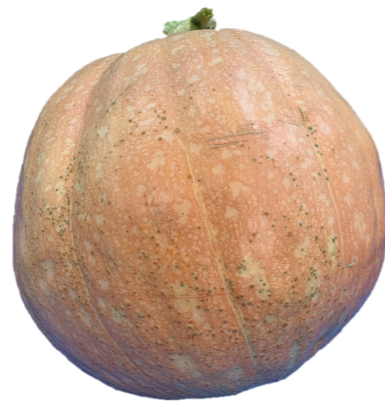
最重量賞 (JA紀南組合長賞)